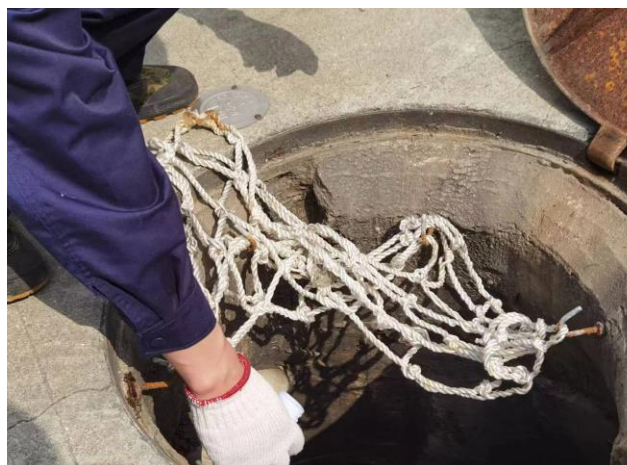
9.对雨水井排口进行取样，送检确定各类指标是否合格，根据检测结果确定是否重开雨水井排放闸